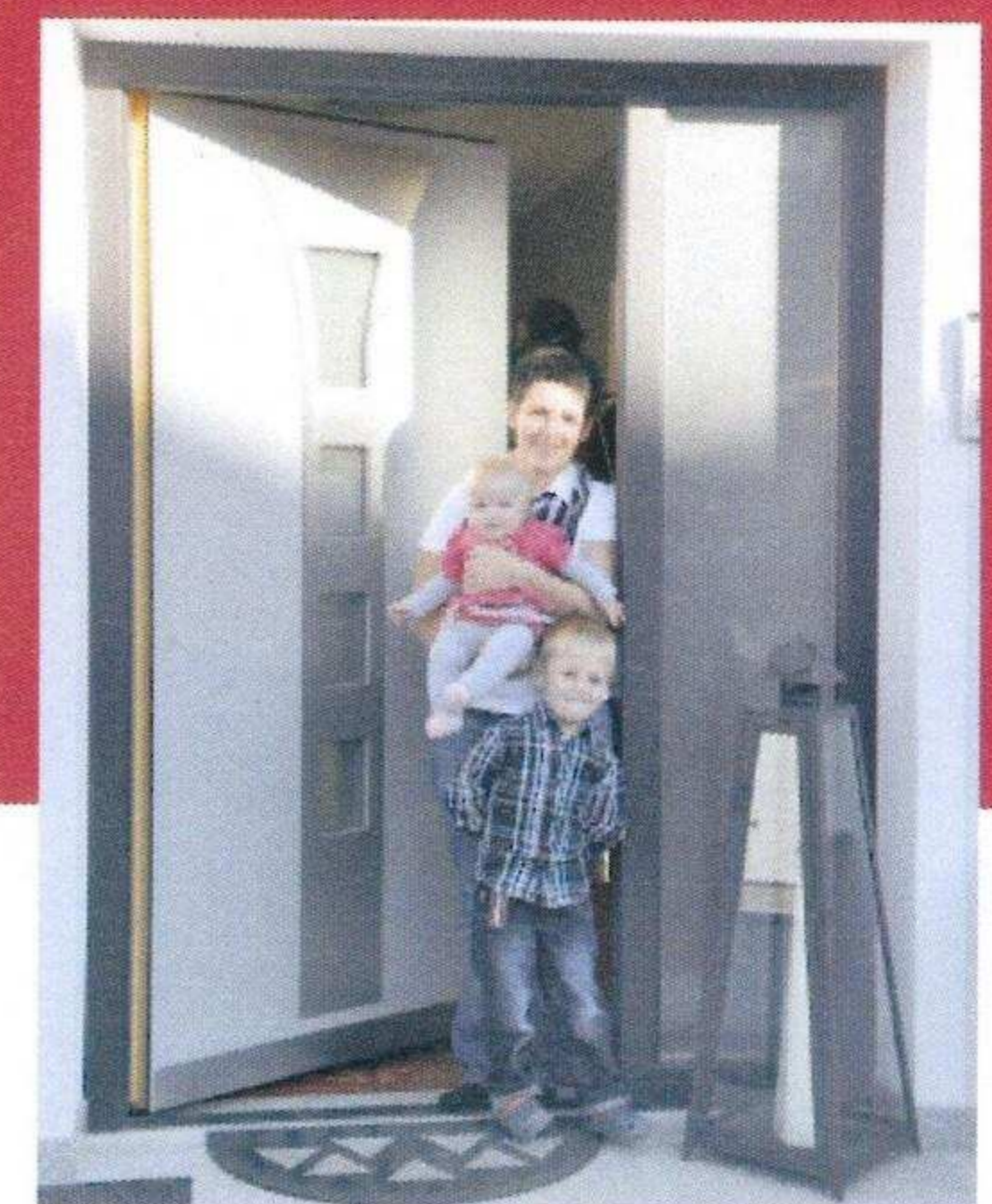
Familie Peschl aus Obdach: „Für unseren Neubau war es die beste Investition“